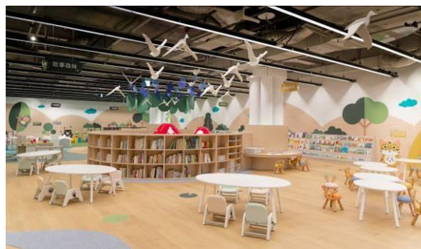
地下一樓五感探索區