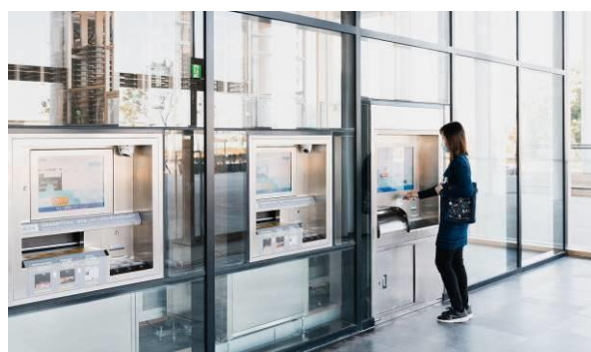
一樓 24H 自助取還書區