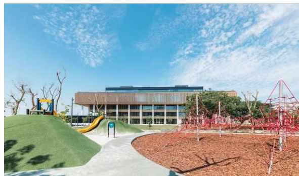
戶外廣場閱之森公園