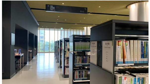
二樓青少年區 (含臺南分區資源中心青少年圖書)