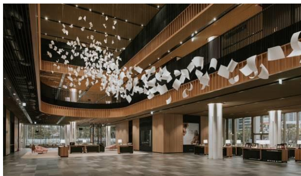
一樓大廳公共藝術-陣風