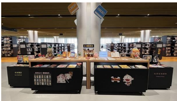
三樓臺南分區資源中心 (文化創意、多元文化及知識性圖書)